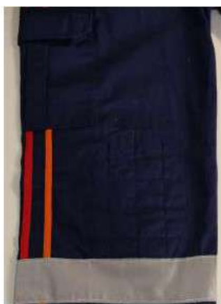
Imagem 03 – bolsos laterais tipo cargo e proteção do joelho