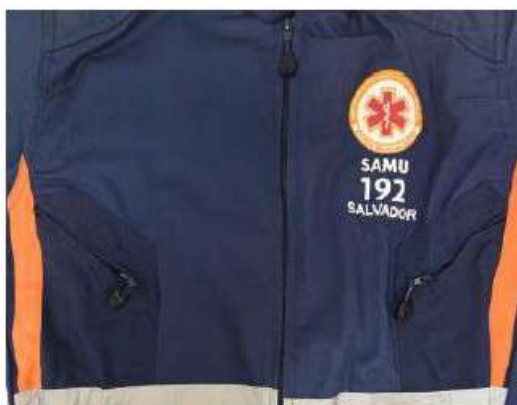
Imagem 9 – Modelo de zíperes frontais com puxadores

De material sintético na cor do tecido, com apresentação fixa de fábrica. A espiral que forma a cremalheira deve ser produzida de monofilamento sintético e deve possuir cinco (05) milímetros de largura. A cremalheira é costurada no cadaço de poliéster, formando os zíperes. A fábrica deve ser certificada pela Confidence in Textiles e de acordo com OEKO TEX padrão 100. O deslizador é de material metálico. Todos os zíperes deverão possuir dispositivo extensor de tecido ou com puxador plástico, na cor do macacão, para facilitar sua abertura/fechamento.