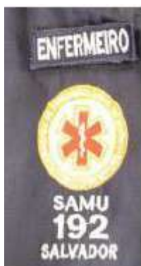
Imagem 6- Logomarca do SAMU 192 e tarjeta de identificação do servidor