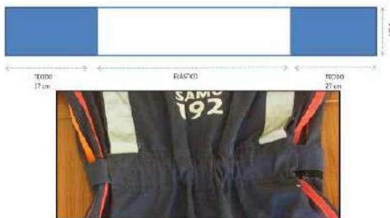
Imagem 4 – Passante e cinto na altura da cintura – costas