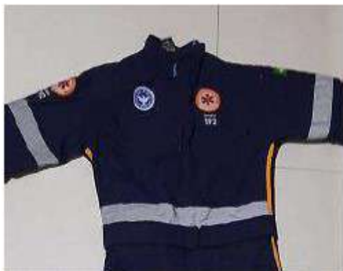
Logomarca da Prefeitura de Salvador