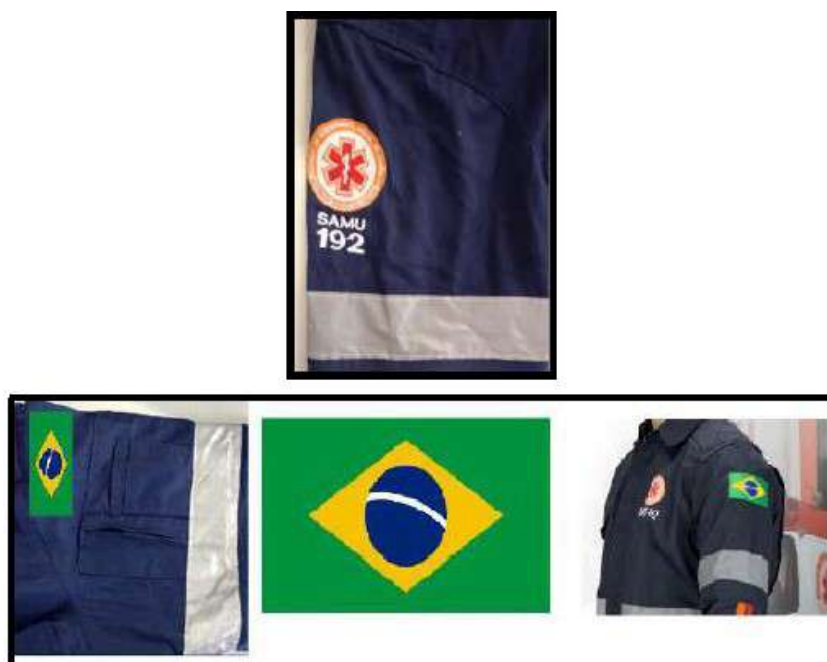
Imagem 7 – Detalhes das mangas direita e esquerda respectivamente